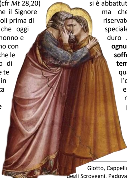
Giotto, Cappella degli Scrovegni, Padova. Incontro di Anna e Gioacchino alla porta d'oro. Particolare

C ari nonni, care nonne! "Io sono con te tutti i giorni" (cfr Mt 28,20) è la promessa che il Signore ha fatto ai discepoli prima di ascendere al cielo e che oggi ripete anche a te, caro nonno e cara nonna. A te. "Io sono con te tutti i giorni" sono anche le parole che da Vescovo di Roma e da anziano come te vorrei rivolgerti in occasione di questa prima Giornata Mondiale dei Nonni e degli Anziani : tutta la Chiesa ti è vicina – diciamo meglio, ci è vicina –: si preoccupa di te, ti vuole bene e non vuole lasciarti solo! So bene che questo messaggio ti raggiunge in un tempo difficile : la pandemia è stata una tempesta